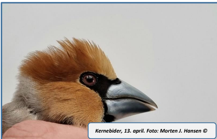
Kernebider, 13. april.

Bedste dag blev 22/4 med 76 fugle – her af Gransanger 31 og Munk 14.