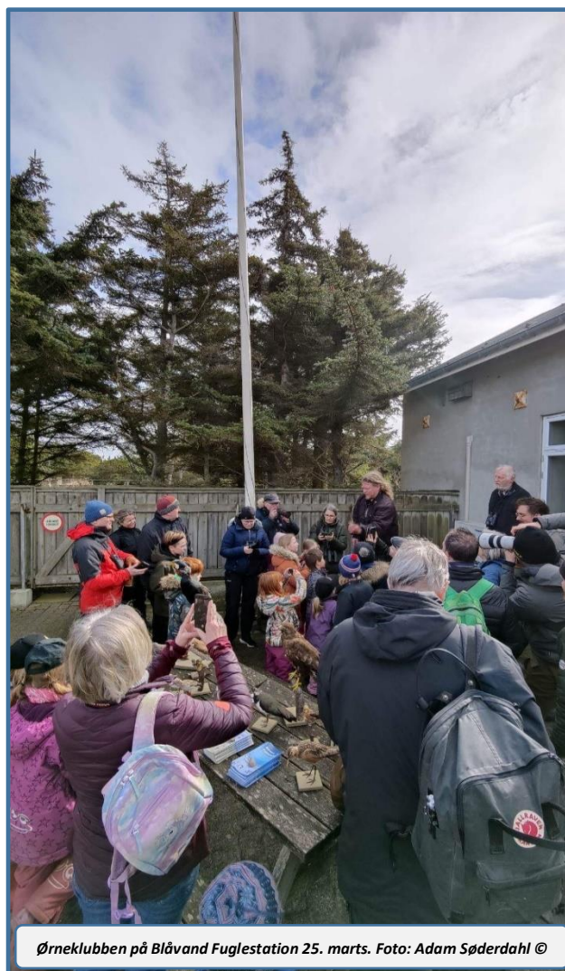
Ørneklubben på Blåvand Fuglestation 25. marts.