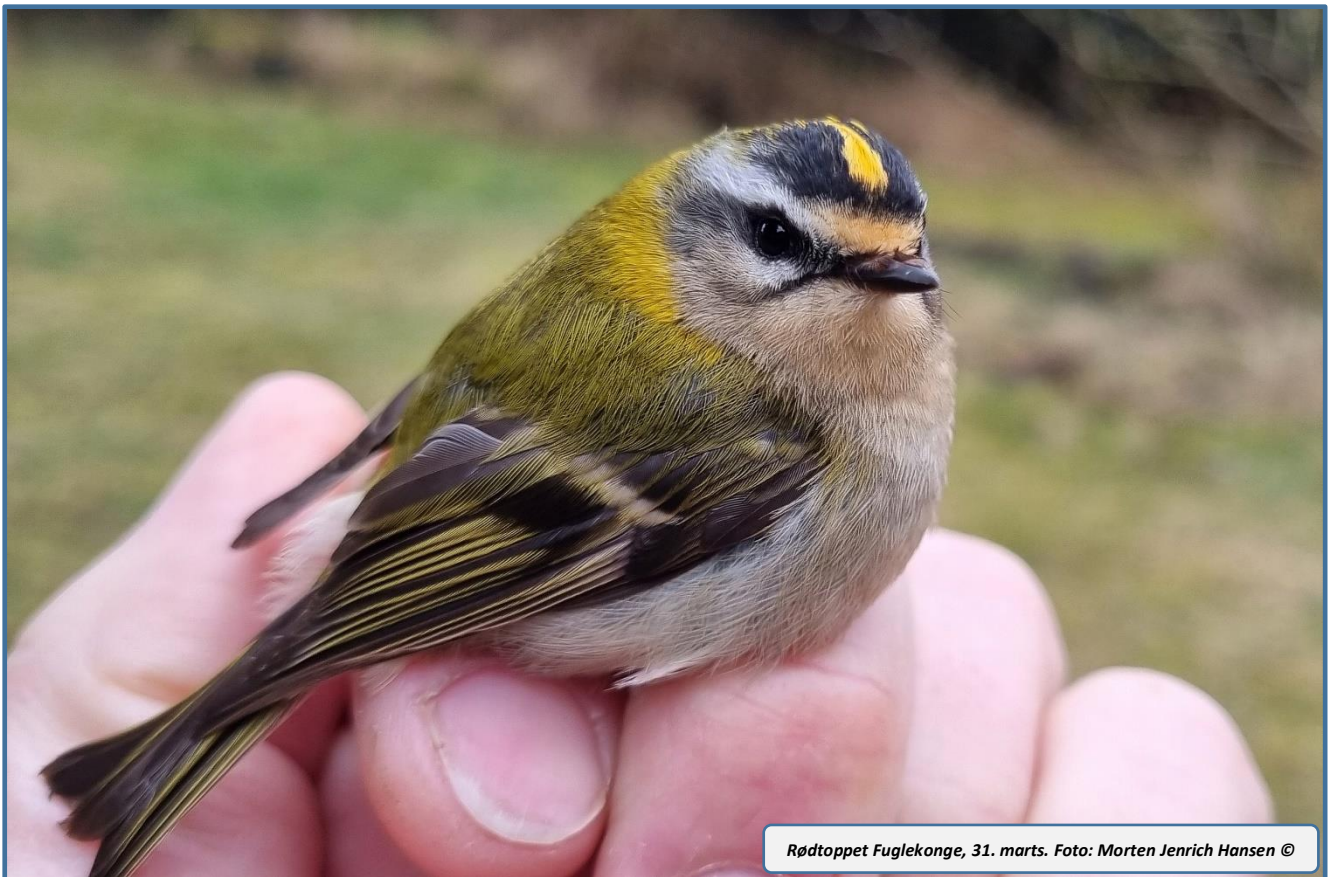
Rødtoppet Fuglekonge, 31. marts.

To Gråsiskener er blevet aflæst. En ringmærket i Hedmark i Norge 18/9 2022 og aflæst ved Blåvand 6/3 2023 og en ringmærket 30/10 2022 i Limburg i Holland og aflæst ved Blåvand 23/4 2023.