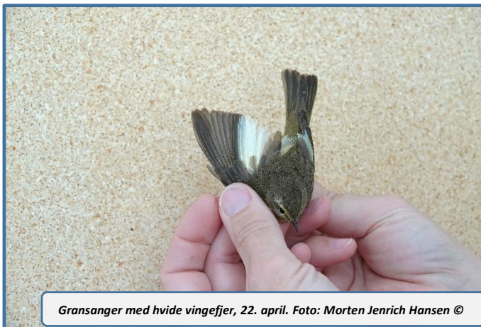
Gransanger med hvide vingefjer, 22. april.

Den 25/3 havde Blåvand Fuglestation besøg af Ørneklubben fra DOF. Hele 26 børn i alderen 6-12 år med forældre lagde vejen forbi for at lære om fugle, se ringmærkning og se fugle på stranden. Nogle var kommet langvejs fra, og de fik alle en stor oplevelse med at se hvordan ringmærkning foregår, og blandt fangsterne var både Rødtoppet Fuglekonge, Rødhals og Bogfinke. På stranden sås Sandløbere og Sildemåger og i klitterne var nogle heldige at se Hugorm. Dagen blev afsluttet med varm kakao og popcorn. Der lyder en stor og varm tak til de engagerede og dygtige guider fra DOF for en spændende dag.