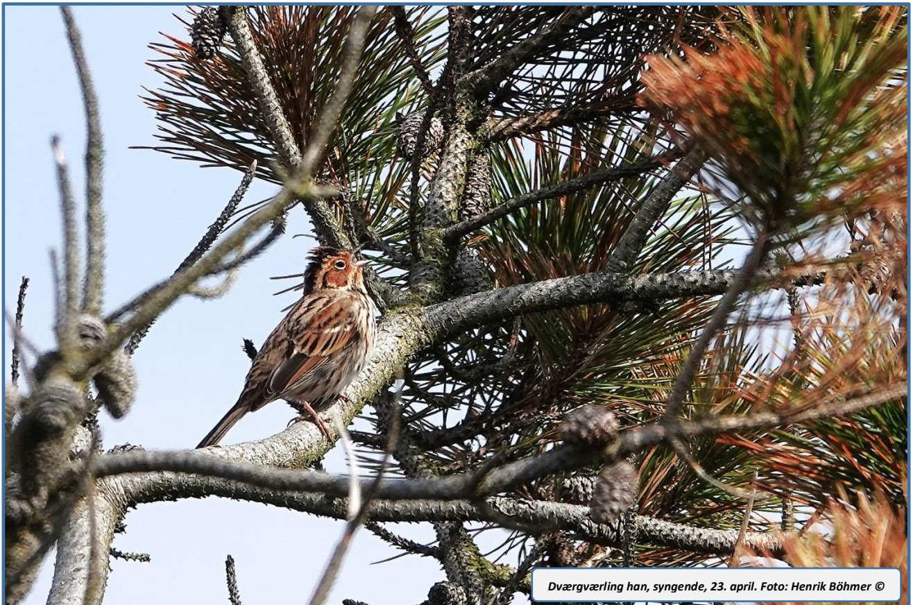
Dvärgværling han, syngende, 23. april.

ved Hvidbjerg og Grønningen. Bjerglærke er en sjælden gæst om foråret ved Blåvand, men en sås 23/3, og 22/4 trak to Atlingænder forbi Hukket.